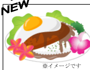
ロコモコランチ 500 円