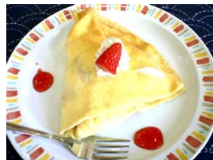
朝摘みイチゴクレープ