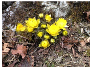
フクジュソウ 早春の福寿草