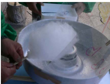
お子様に大人気のわた菓子

サマーフェアクーポン券をお持ちのお客様は、上記期間中ご使用いただけます。ここぞとばかりにふわっふわっわた菓子や限定特別メニュー等にお使い下さい。もちろん充実した通常メニューも取り揃えています。この機会に全メニュー制覇して伝説を作ってみてはいかがでしょうか。