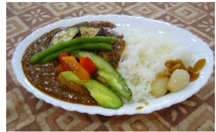
夏野菜カレーの盛り付け例です。